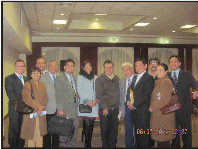
JORNADA DE ENDOCRINOLOGIA AREQUIPA 6-7 JULIO 2012