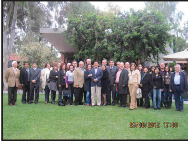
CONGRESO INTERNACIONAL EN PREDIABETES Y SÍNDROME METABOLICO 23 - 25 AGOSTO 2012