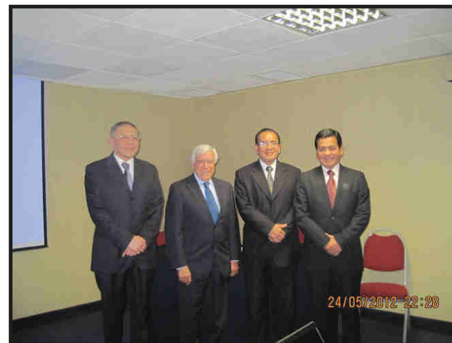
SIMPOSIO CON LA SOCIEDAD PERUANA DE CARDIOLOGIA 24 MAYO 2012

En dólares: 0111-610001000-10735-77 / En soles : 0111-610001000-10727-74