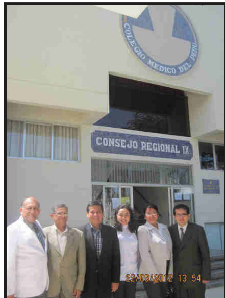
JORNADA DE ENDOCRINOLOGIA EN ICA 21 - 22 SETIEMBRE 2012