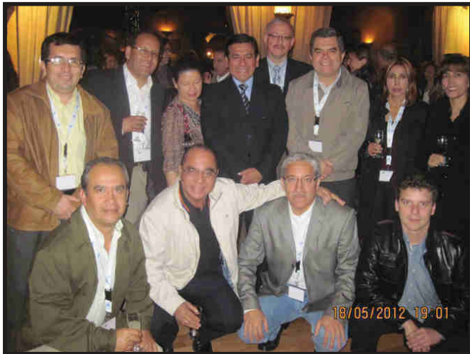
SUMMIT DIABETES EN SANTIAGO DE CHILE 18 MAYO 2012